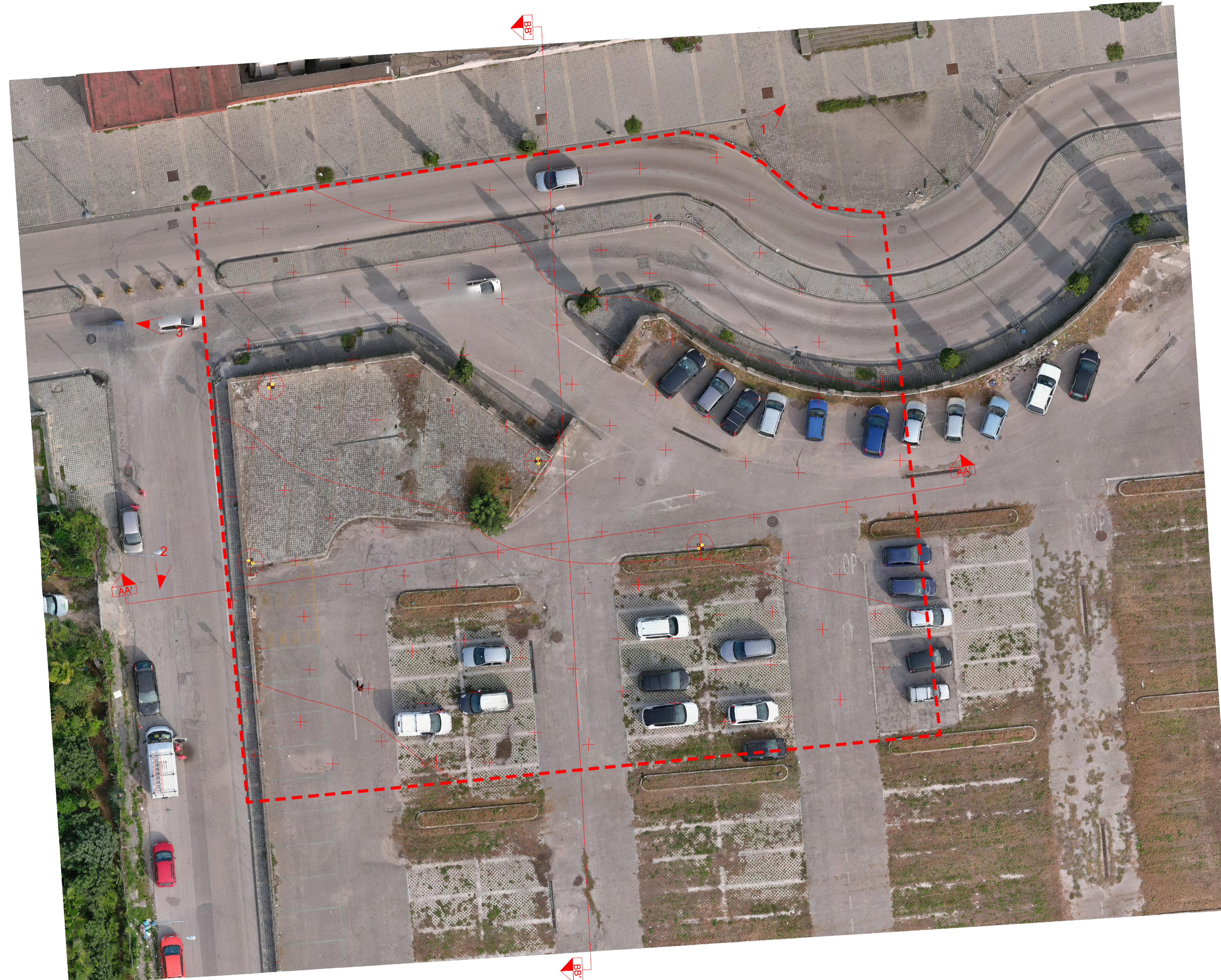
Ortotofo - stato di fatto - scala 1:200